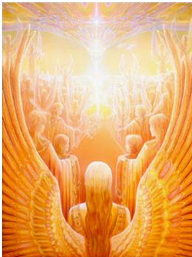
The Heaven of Angels by Catherine Andrews

De kwaliteit die dit centrum biedt en met name de heerlijke lunch, maakt dat wij hier weer voor kiezen. Ook nu lukt het weer om de kosten beperkt te houden en kunnen wij de dag aanbieden voor € 55,- per persoon. Indien de kosten voor iemand lastig zijn op te brengen dan kunt u daar net als andere jaren weer contact over opnemen met de St. Urantia Nederlandstalig.