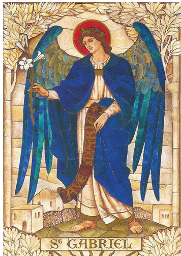
Gabriel by James Powell & Sons

Hiermee hebben we toch weer een volle nieuwsbrief en hopen u daarmee goed op de hoogte te houden. We wensen een ieder een