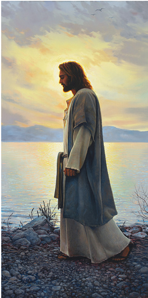
Walk with me by Greg Olsen

Een andere overeenkomst is te zien in het einde van het leven van Mithras hier op aarde, wanneer hij in een koets naar de hemel rijdt. In de Bijbel wordt ook de hemelvaart van Jezus beschreven als een opstijging van zijn lichaam naar de hemel.