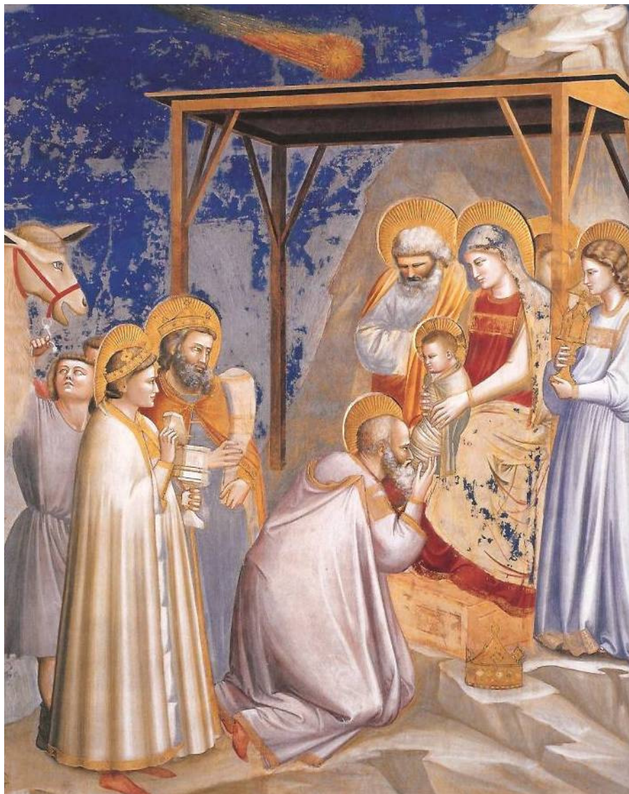
Detail Fresco van Giotto

Met deze inspirerende, hoopvolle en dankbaar stemmende gedachte ga ik het Kerstfeest vieren en wens ik u allen een gezegend Kerstfeest met de Vrede van Jezus en veel Liefde en Licht.